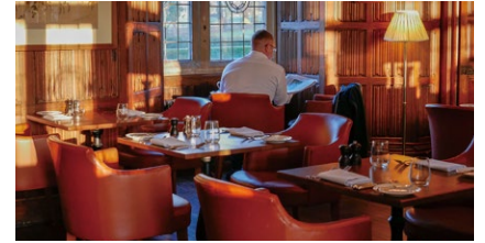
ラシュトン・ホール・ホテルの朝食風景